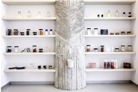
Particolare dell'allestimento "Pirelli, la cultura sostenibile", 2016