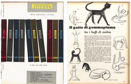
Bob Noorda, copertina della rivista "Pirelli", 1957 Bruno Munari, articolo per la rivista "Pirelli", 1949

Prenotazione obbligatoria scrivendo a: scuole@fondazionepirelli.org o chiamando il numero 02 64423971 Fino a esaurimento posti