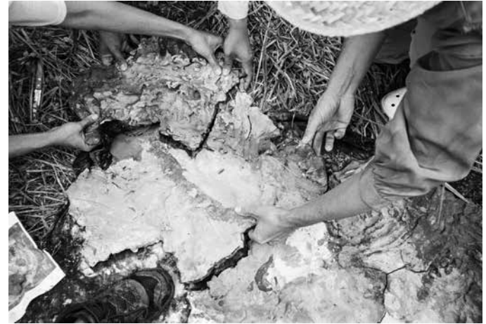
No Source Found, 2019 (making of) Ceramica, dimensioni variabili Courtesy dell'artista e Giò Marconi, Milano Foto: Samuel Lang Budin

Come spiega l'artista, «Il titolo si riferisce al messaggio di errore sui proiettori quando non viene rilevato il supporto su cui sono registrati i materiali, e al contempo ai limiti della documentazione archeologica e della comprensione della storia della cultura filippina antecedente alla colonizzazione spagnola e americana».