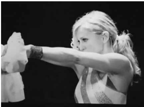
Madonna y el Niño , 2010 (still da video) Video monocolore, 25"14", colore, suono, sfera stroboscopica

L'opera attinge a molteplici immaginari: dalla popstar Madonna all'iconografia cristiana della Vergine Maria, fino al fenomeno climatico El Niño legato al riscaldamento periodico dell'Oceano Pacifico Equatoriale centrale e centro-orientale. Concepita come un'installazione video, Madonna y El Niño riflette l'interesse dell'artista per i fenomeni naturali e la cultura popolare, mettendo a confronto l'evoluzione linguistica della produzione culturale di Madonna con il ciclo dell'acqua. Facendo ricorso ai significati metaforici e mitologici di questo elemento, Baga lo evoca spesso per le sue proprietà fisiche e simbolicamente duttili. Queste caratte-