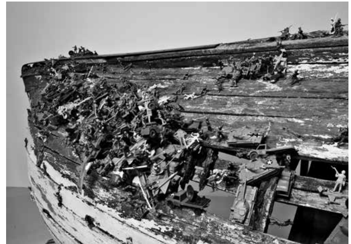
Six Roots Enfance / Garçon – Childhood / Boy , 2000 (particolare) Barca in legno, soldatini e carrarmati giocattolo di plastica, metallo 173 x 382 x 150 cm

Questo lavoro fa parte di un progetto più complesso composto da 7 installazioni che rappresentano 6 allegorie. La prima parte del titolo è un riferimento a un'espressione buddista ( six roots , "sei radici") che indica le capacità sensoriali del corpo: vista, udito, olfatto, gusto, tatto e conoscenza. Da queste abilità percettive Chen Zhen prende spunto per dare forma a una metafora sulle differenti attitudini e sui temperamenti delle fasi della vita – nascita, infanzia, conflitto, sofferenza, memoria, morte e rinascita – mettendo in luce talvolta alcuni aspetti contraddittori dell'animo umano. In particolare, per rappresentare l'infanzia e la giovinezza l'artista espone, sospeso e capovolto, il relitto di una barca ricoperta da soldatini di plastica che richiamano le incrostazioni marine che si formano sulle imbarcazioni.