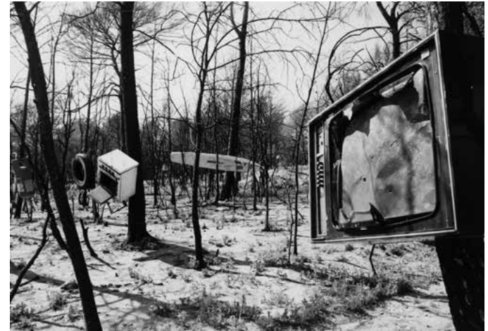
Un monde accroché / détaché , 1990 Oggetti trovati, 1000 m 2 circa Veduta dell'installazione, Pourrières, 1990 Courtesy GALLERIA CONTINUA Foto Chen Zhen

incomprensioni e conflitti fra un popolo e un altro, fra la gente e la società, fra la gente e madre natura, fra la gente e la scienza e la tecnologia, fra un continente e l'altro, fra un gruppo etnico e l'altro».