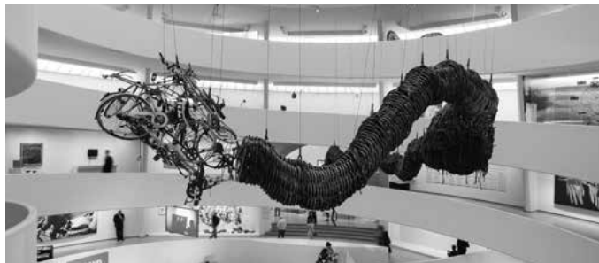
Precipitous Parturition , 1999 Veduta dell'installazione, Solomon R. Guggenheim Museum, New York, 2018

la scultura Precipitous Parturition (1999) con cui l'artista partecipa a "Cities on the Move", una grande mostra collettiva itinerante a cura di Hou Hanru e Hans Ulrich Obrist, che rifletteva sull'urbanizzazione delle metropoli asiatiche. L'opera di Chen Zhen, composta da centinaia di ruote e camere d'aria di bicicletta, evoca la forma di un dragone lungo 20 metri, il cui ventre è ricoperto da macchinine di plastica nere. Analogamente ad altre installazioni dell'artista, Precipitous Parturition richiama tramite processi fisici e corporei una metafora del cambiamento storico: la trasformazione dell'industria cinese, che da una tradizionale produzione artigianale ha avuto un forte impulso verso un'economia su scala globale. Come questa installazione, che rivela una spiccata sensibilità verso l'aspetto formale dell'opera e la sua dimensione fisica, i lavori di Chen Zhen toccano aspetti profondi legati all'umanità e alle contraddizioni proprie dei valori della società contemporanea.