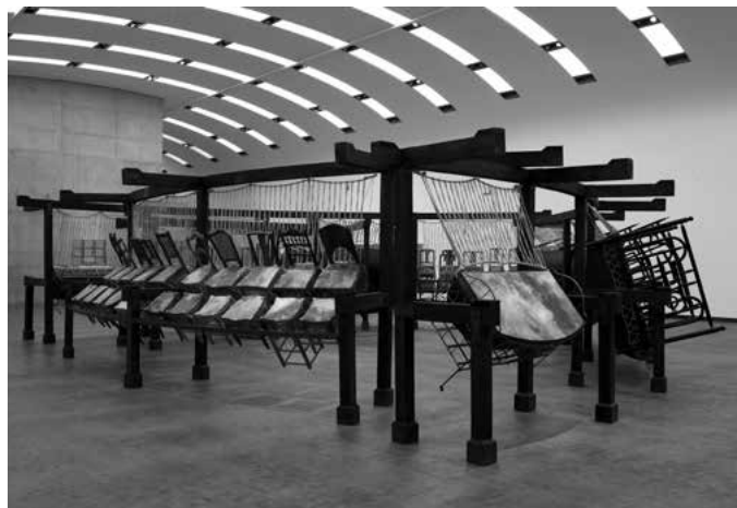
Jue Chang, Dancing Body – Drumming Mind (The Last Song), 2000 Letti, sedie, pelli di vacca, legno, metallo, spago, corda 244 x 1800 x 1400 cm

La monumentale installazione è composta da letti, sedie e sgabelli le cui superfici sono rivestite da pelli di vacca. La complessa composizione, che richiama un grande strumento a percussione, si estende su un'area di 18 x 14 metri ed è stata realizzata da Chen Zhen con elementi provenienti da luoghi e contesti differenti, creando quella che lui stesso ha definito “installazione relazionale”, espressione del suo interesse per i processi di trasformazione sottesi ai rapporti sia tra gli oggetti sia tra gli esseri umani. Alludendo alla cura del corpo e dello spirito, Jue Chang, Dancing Body – Drumming Mind (The Last Song) può essere attivata da alcuni danzatori, attraverso lo sfioramento e la percussione delle pelli con le mani, i cui movimenti riconducono alla pratica del massaggio cinese.