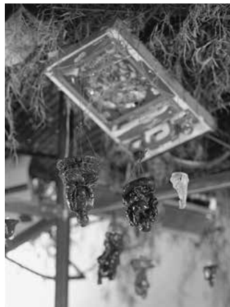
Fu Dao / Fu Dao, Upside-down Buddha / Arrival at Good Fortune, 1997 (particolare)

Il titolo della mostra – “Short-circuits” [cortocircuiti], concetto su cui Chen Zhen basa il proprio metodo creativo – fa riferimento alle molteplici interpretazioni che emergono dall'incontro di idee ed elementi che, nelle opere dell'artista, si trovano in apparente contrapposizione, tra cui tradizione e modernità, centro e periferia, spiritualità e consumismo.