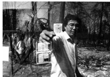
Chen Zhen a Pourrières, 1990

Chen Zhen (Shanghai, 1955 – Parigi, 2000) è una delle principali figure della scena artistica a superare, dalla fine degli anni Ottanta, il divario tra l'estetica orientale e quella occidentale, influenzando un'intera generazione di artisti. Nato a Shanghai a metà degli anni Cinquanta, cresce durante la Rivoluzione culturale in Cina in una famiglia di medici nel territorio della Concessione francese della città. Chen Zhen consegue una laurea alla Shanghai School of Fine Arts and Crafts nel 1973 e, qualche anno più tardi, nel 1978, si specializza in scenografia al Drama Institute di Shanghai dove, nel 1982, diventa professore.